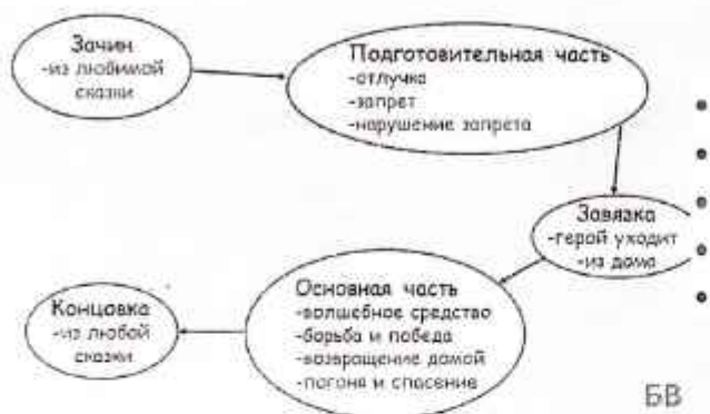
Схема сочинения волшебной сказки